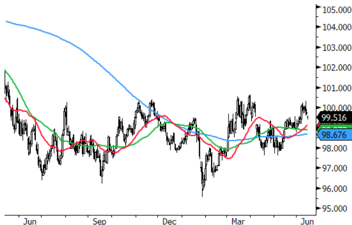
DXY Currency (DOLLAR INDEX SPOT) Monex Analisis Apertura Daily 13MAY2025-15JUN2026 Copyright© 2026 Bloomberg Finance L.P. 15-Jun-2026 06:07:08