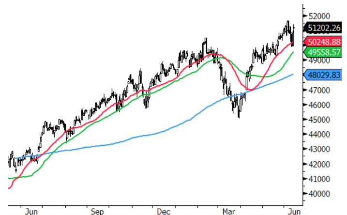
INDU Index (Dow Jones Industrial Average) Monex Analisis Apertura Daily 13MAY2025-15JUN2026 Copyright© 2026 Bloomberg Finance L.P. 15-Jun-2026 06:07:32